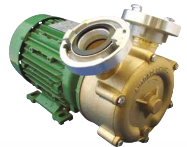
EP Bronze mit C-Kupplung*