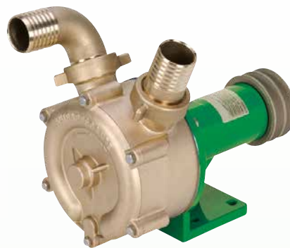
EP für Keilriemenantrieb mit Lagerfuß*