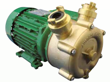
EP Bronze mit GEKA-Kupplung*